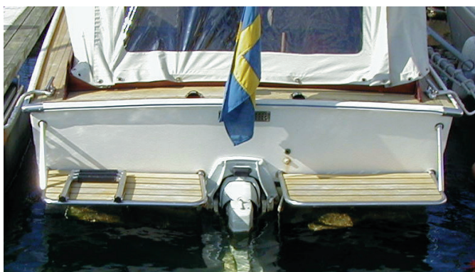
PM4580 (alt. PM4550, PM3642)

Beroende på drevets placering bör ni mäta om ni kan sätta en hel plattform över drevet eller om det måste placeras en mindre plattform på var sida om drevet. Det samma gäller när det är en båt med utombordsmotor.